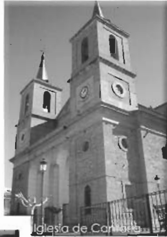
Iglesia de Cantoria