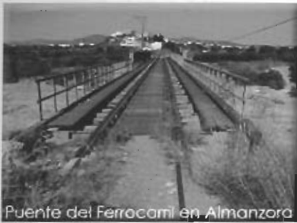
Puente del Ferrocami en Almanzora