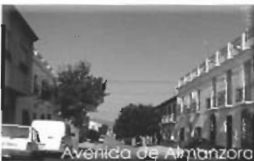
Avenida de Almanzora