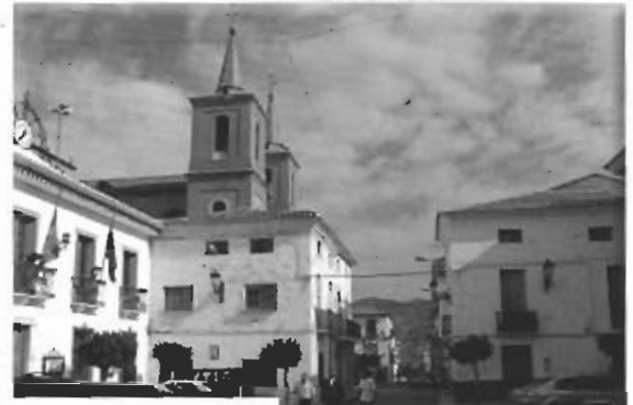
Plaza de la Constitución