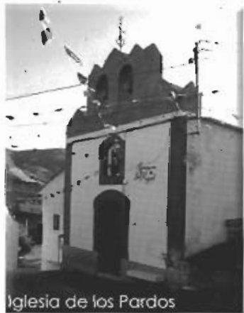
Iglesia de los Pardos