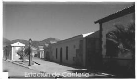
Estación de Cantoria