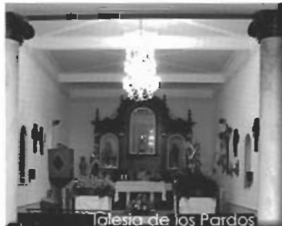
Iglesia de los Pardos