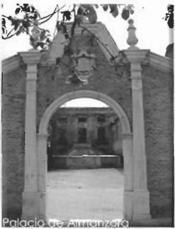
Palacio de Almanzora