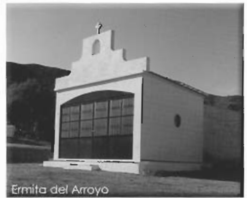
Ermita del Arroyo